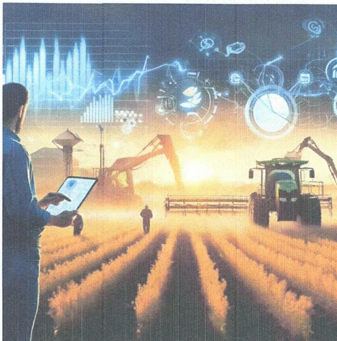
Figura 1 Desafíos económicos en la Automatización

En la figura se muestra a una persona analizando datos financieros en un campo, teniendo datos en línea.